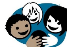
Ver ein god venn