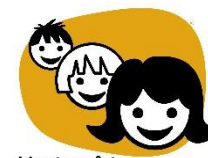
Vente på tur