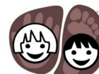
Armar og bein